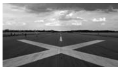
C.-E. Froidevaux, CH c.e.f.over-blog.com